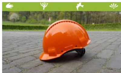
Veilig werken quiz: helmpje op, helmpje af