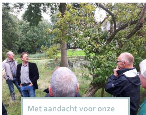
Met aandacht voor onze vragen.