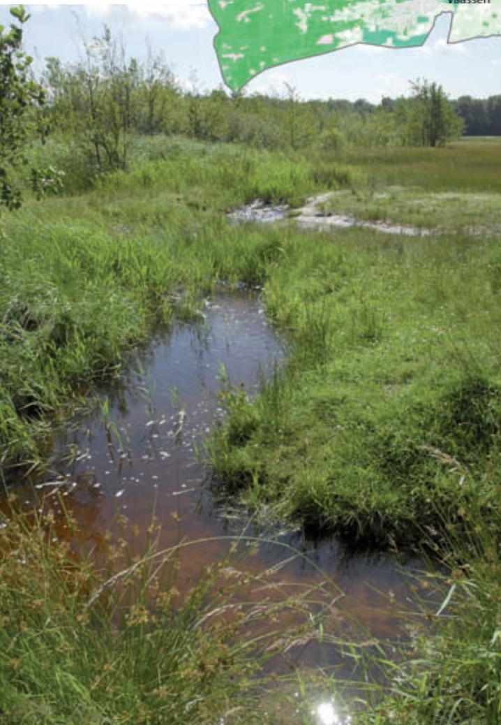
Beek bij Wisselse Veen

beekdalen ten zuiden van Apeldoorn zijn over het algemeen ondiep en iets breder dan in de noordelijke IJsselvallei. De beken hebben een gekanaliseerd profiel en zijn door het sterk wissellende landschapsbeeld langs de beken niet goed herkenbaar in het landschap.