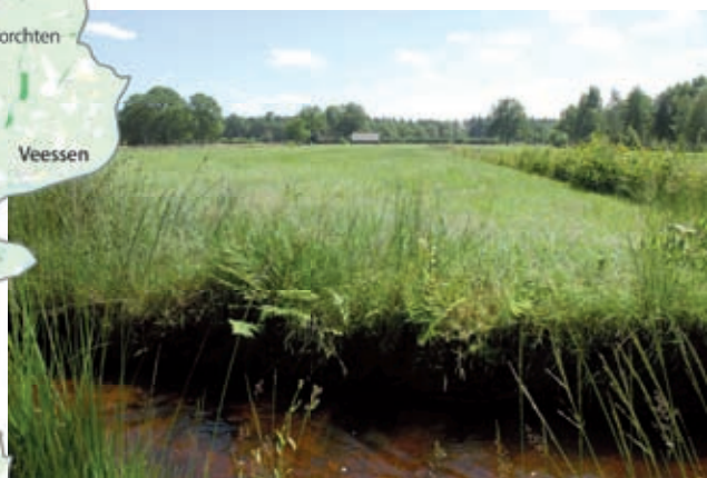
Beek bij Epe

De beken en beekdalen liggen vaak in de nabijheid van de hogere oude gronden en soms in kernen waardoor ze slecht herkenbaar zijn in het landschap.