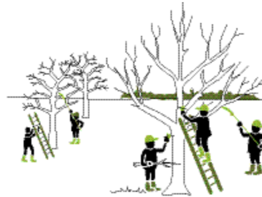
Aan de slag in het landschap.