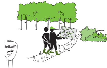
Ontwikkelen van recreatieve wandelroutes.