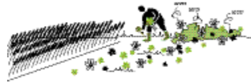
Bloemrijke bermen aanleggen.

Meer informatie hierover is te vinden via: http://samenaanzet.nijkerk.eu/