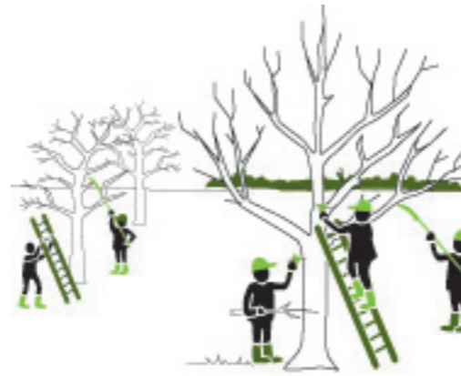
Aanplanten en onderhouden hoogstamboomgaarden