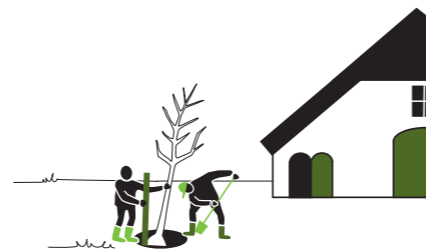
Versterken streekeigen landschap door aanleg van landschappelijke beplanting en erfplanting.